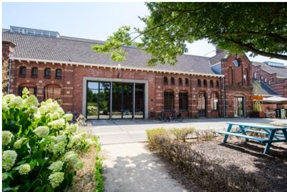
Zuiveringshal Oost in Cultuurdorp Westergas in Amsterdam.